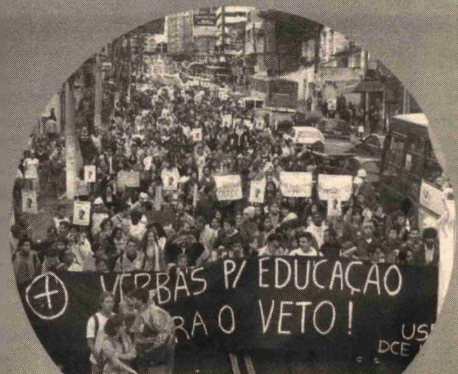
Mobilizações por mais verbas para a Educação, ocorridas no ano passado.

Por fim, deve-se cobrar o financiamento público para a educação, e de nenhum outro tipo, por duas razões: para que a Universidade possa manter sua autonomia frente ao mercado e isso só poderá ser alcançado através financiamento público, pois este é capaz de proporcionar à universidade a capacidade de atender a sociedade como um todo, e não apenas um grupo específico, com objetivos específicos e porque a educação não pode e não deve ser tratada como mercadoria, podendo ter acesso a ela apenas aqueles capazes de comprá-la. Entendendo-a como um importante elemento de transformação e desenvolvimento da nação, esta deve ser pública, gratuita, de qualidade e para todos.